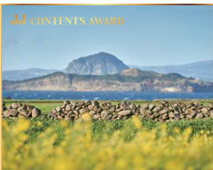
'탐나는전' 상품권 (30만원 상당) 濟州專用地域通貨商品券 (30万ウォン相当)