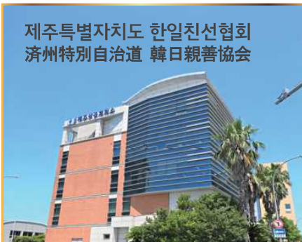
제주특별자치도 한일친선협회 濟州特別自治道 韓日親善協會