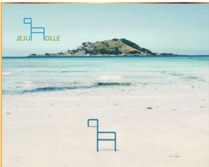
올레센터 이용권 (50만원 상당) 올레센터-利用券 (50万ウォン相当)