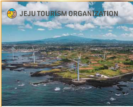
제주도 내 호텔 숙박권 (1박) 濟州島内ホテルペア宿泊券 (1泊)