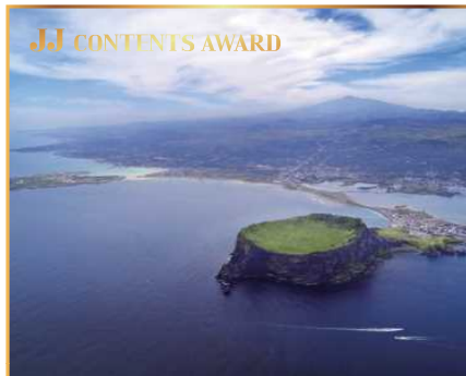
'탐나는전' 상품권 (30만원 상당) 濟州專用地域通貨商品券 (30万ウォン相当)