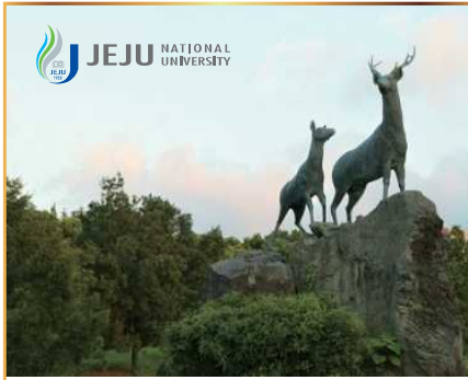
'제주대학교 발전 후원의 집' 식사권 (30만원 상당) 「濟州大学校發展後援の家」食事券 (30万ウォン相当)