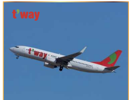
제주-오사카 왕복항공권 (1인 2매) 濟州-大阪往復航空券 (ペア)