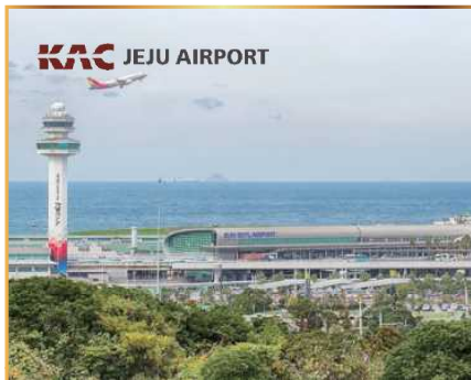
제주-일본 (나리타 또는 오사카) 왕복항공권 (1인 2매) 濟州-日本 (成田または大阪) 往復航空券 (ペア)